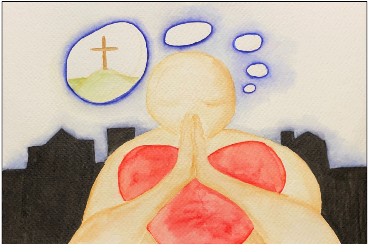
Arte de Linda Furtado