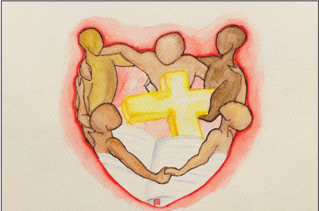
Arte de Linda Furtado