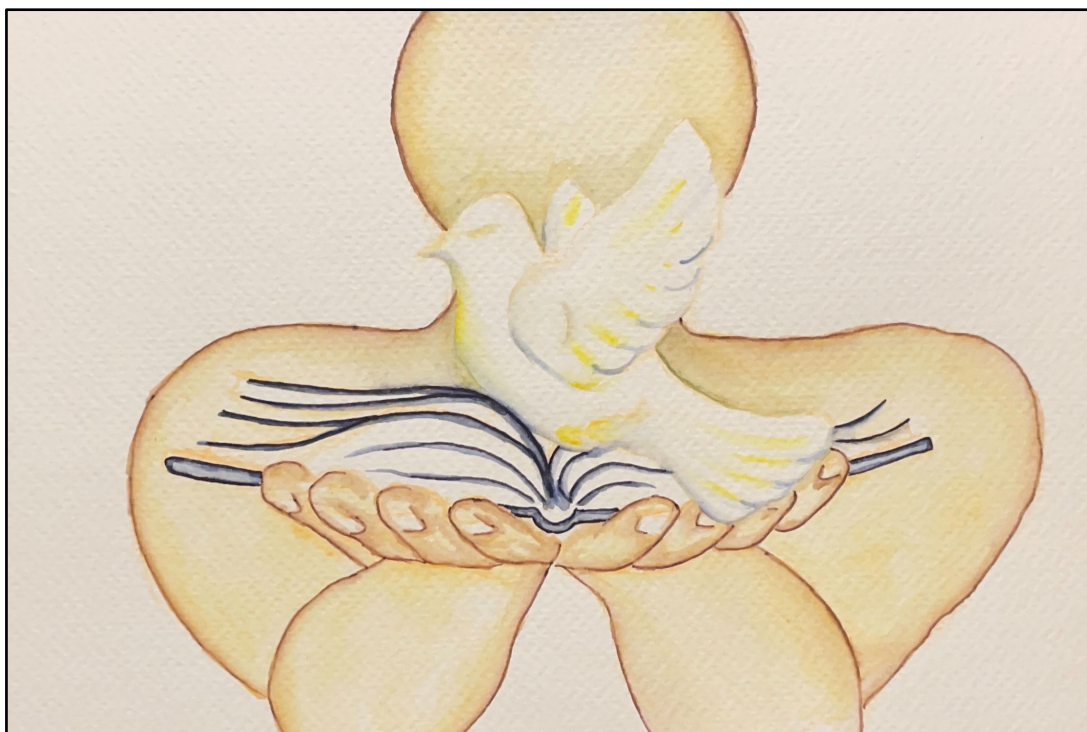
Arte de Linda Furtado